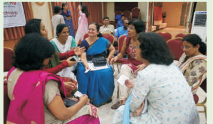
कराड : खाजगी वैद्यकीय व्यवसायिकांच्या चर्चासत्रात गटचर्चा करताना सहभागी