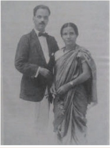
क्रांतदर्शी र. धों. कर्वे

संतती नियमन या शब्दाचे जनक र. धों. कर्वे यांना उपेक्षित द्रष्टा ज्ञानयोगी असं म्हणायला हवं, कारण अमेरिकेत १९१६ मध्ये मागरिट सॅंगर आणि १९२१ साली इंग्लंडमध्ये मेरी स्टोप्स व भारतात र.धों. कर्वे यांनी संतती नियमनाचा सल्ला देणारं व साधनं पुरवणारं केंद्र सुरु केलं. १९२३ साली 'संतती नियमन', नावाचं पुस्तकही त्यांनी प्रकाशित केलं. दोघी